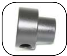
Enchufe de Tubo Inferior (BTP09)