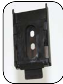
Ménsula de Doselera (VB09)